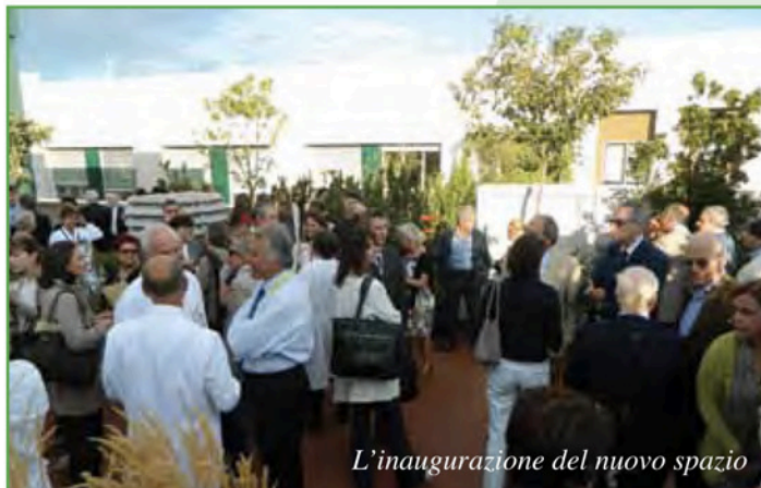
L'inaugurazione del nuovo spazio